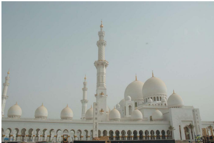
谢赫扎耶德清真寺