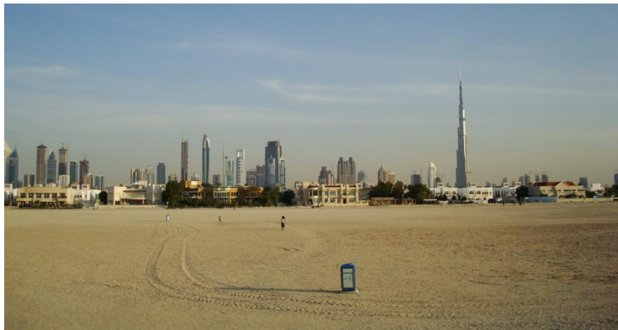
迪拜中央商务区远眺

世界经济论坛《2019年全球竞争力报告》显示，阿联酋在全球最具竞争力的141个国家和地区中，排第25位。