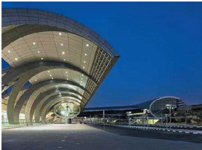
迪拜国际机场T3航站楼外景