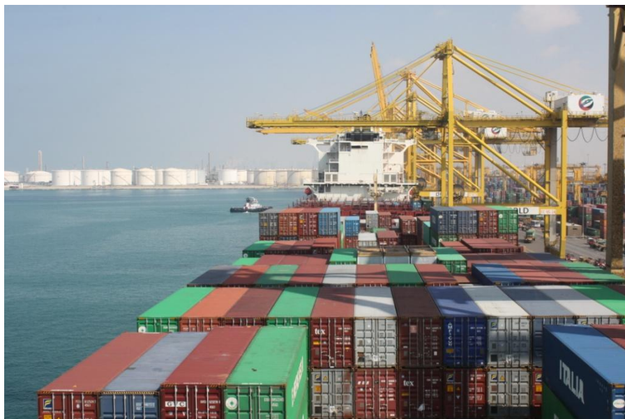
杰贝阿里集装箱码头

哈利法港，为阿布扎比最大的商业港口，目前一期已完工。项目第一阶段包括具有年处理200万20英尺标准箱能力的港口和面积51平方公里的工业区A区。哈利法港已取代扎耶德港成为阿布扎比的主要货运港。目前，哈利法港口吞吐量为250万标箱和1200万吨一般货物。中远海运码头公司于2016年9月获得二期码头35年特许经营权。2018年12月10日，中远海运港口阿布扎比码头正式开港。2019年5月，中远太阳轮和双鱼座轮两艘可载两万标箱以上的超大巨轮相继停靠中远海运阿布扎比码头。