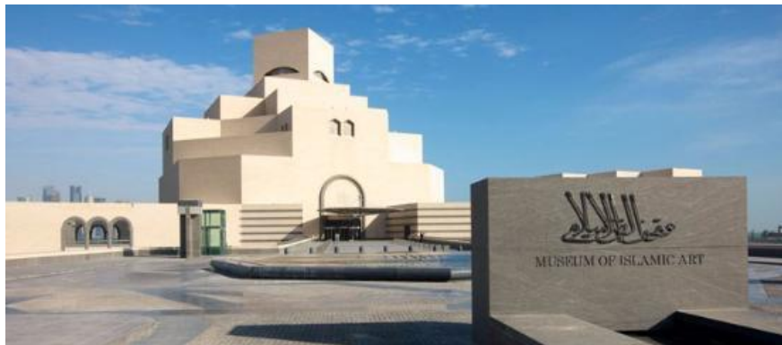
多哈伊斯兰艺术博物馆