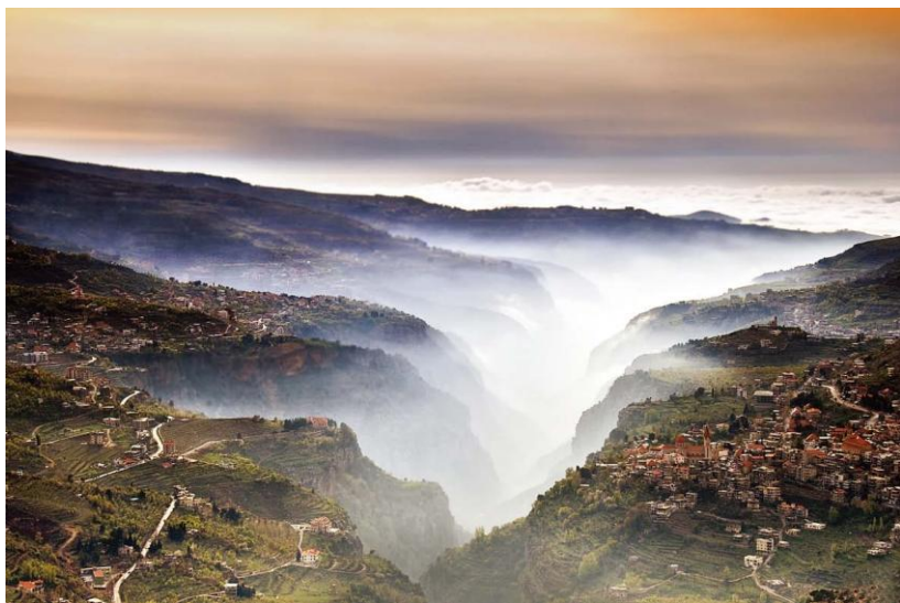
世界遗产—加迪沙峡谷

【外籍劳务】黎巴嫩的外籍劳务主要集中在建筑、餐饮、家政服务等行业或岗位，外籍劳务主要来自叙利亚、埃塞俄比亚、菲律宾、埃及等国家和地区，目前叙利亚在黎巴嫩难民超过110万，给黎巴嫩劳务市场带来了大量的劳务供给。黎巴嫩失业人口占劳动人口总数的25%。为限制外国人在黎巴嫩务工，黎巴嫩政府要求所有外籍务工人员必须取得劳工证及居住证。按照黎巴嫩政府划定标准，中国人员基本被划定为一级（共计七级，一级收费最高），两证年费约2400美元/人。