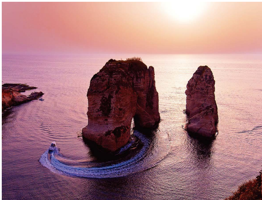
贝鲁特著名景点“鸽子岩”

所属时区为东2时区，比北京时间晚6个小时。每年3月最后一个周日至10月最后一个周日期间实行夏令时，比北京时间晚5个小时。