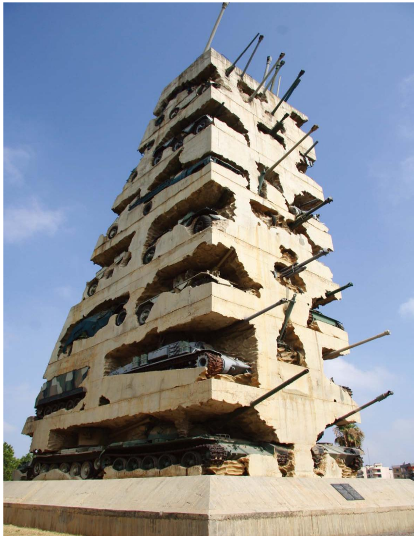
黎巴嫩内战纪念碑