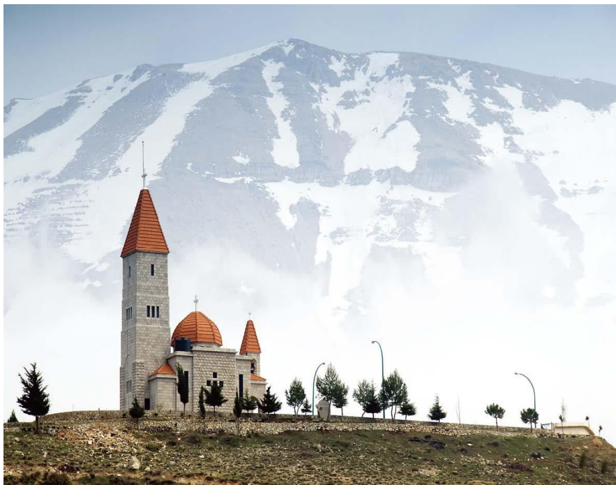
大雪山旁巴沙尔镇的教堂