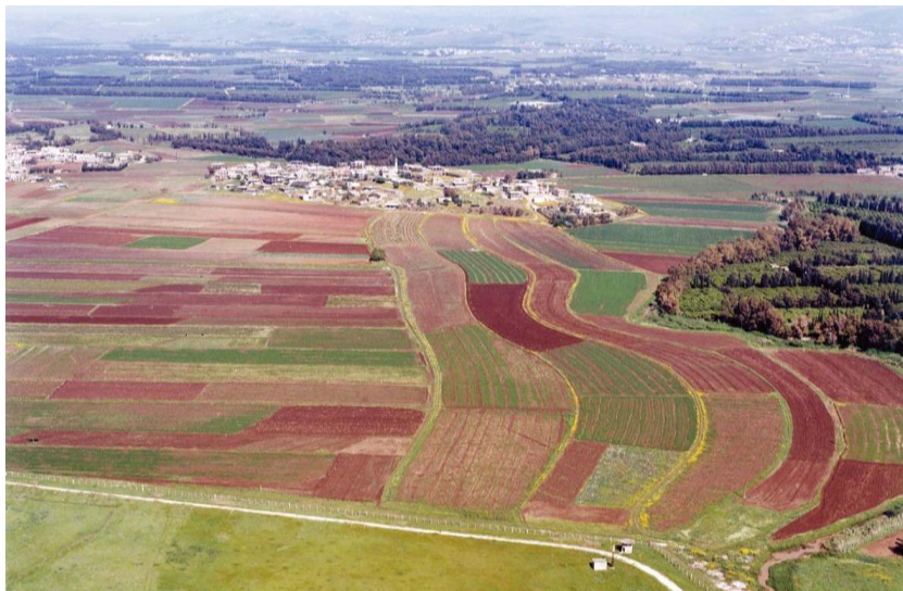
“黎巴嫩粮仓”贝卡谷地