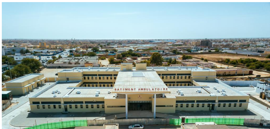
中国援毛里塔尼亚传染病专科门诊楼

据世界卫生组织统计，2018年毛塔全国经常性医疗卫生支出占GDP的4.6%，按照购买力平价计算，人均经常性医疗卫生支出595.7美元；2019年，出生时的预期人均寿命为74岁。