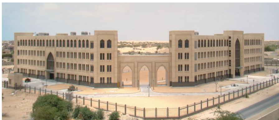
毛里塔尼亚外交部和经济部

毛里塔尼亚从地理、文化、社会诸方面上看，既是阿拉伯国家，又是非洲国家，被称为阿拉伯—非洲之桥。因此，它兼有阿拉伯和非洲的风俗习惯。