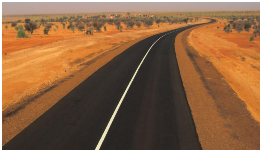
罗索—博盖公路2标段，全长94公里

目前，毛里塔尼亚首都至各省会均有公路连接。其中多数是柏油马路，少数是加固土路。2013年，全国公路总计4460公里，柏油马路3000公里，加固土路里程1015公里，其余为一般土路。主要的公路有努瓦克肖特-布提里米特-阿莱格-基法-阿云-内马公路，全长1100公里，向东通往马里，称为“希望公路”；努瓦克肖特-努瓦迪布公路，493公里向北通往西撒哈拉和摩洛哥，努瓦克肖特-罗索公路，203公里南经罗索通往塞内加尔；努瓦克肖特-阿克儒特-阿塔尔公路，451公里向东北方连接祖埃拉特铁矿区通往阿尔及利亚边境。