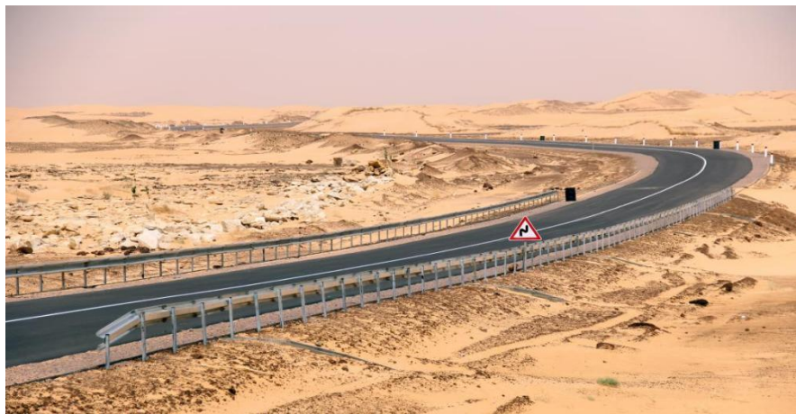
Atar-Tidjikja公路第三标段项目