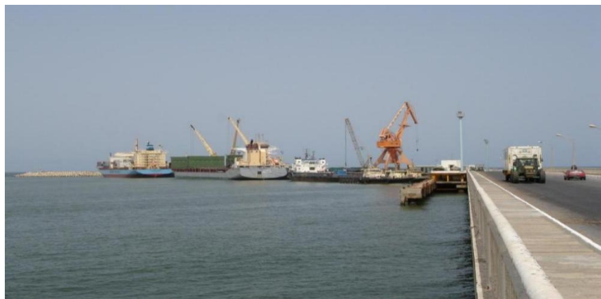
中国援建毛塔友谊港日晟公司码头

毛塔有努瓦克肖特和努瓦迪布两个港口，年吞吐量1670万吨，其中努瓦克肖特友谊港350万吨，努瓦迪布港120万吨，工矿公司矿石码头1200万吨。有两家公司承担海运业务，分别是马士基（MAERSK）和寿格高（SOGEGO）。