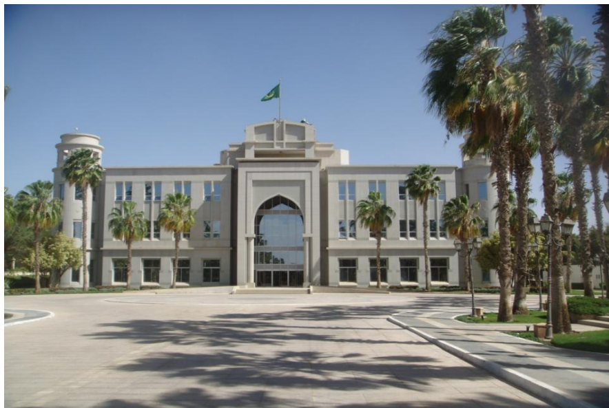
毛里塔尼亚总统府