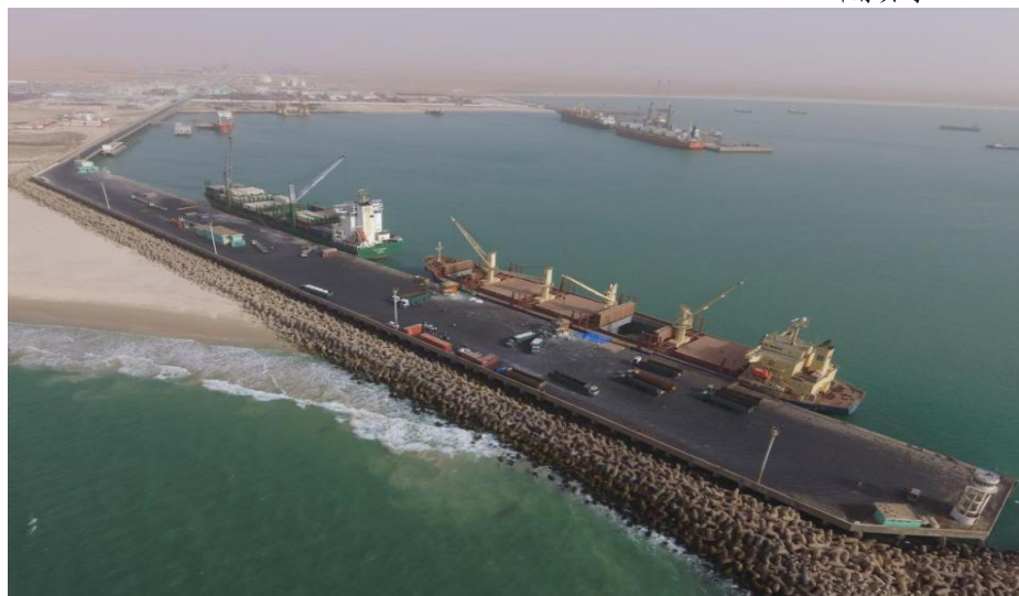
投入使用的友谊港1、2、3#泊位