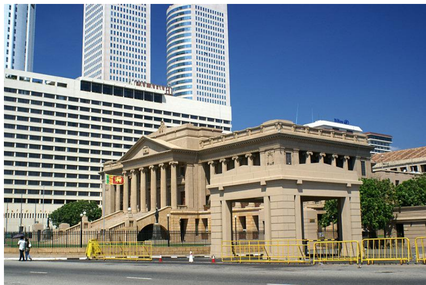
总统秘书处办公楼

【总统】总统为国家元首、政府首脑和武装部队总司令，享有任命总理和内阁成员的权力。现任总统为戈塔巴雅·拉贾帕克萨，于2019年11月宣誓就职，任期5年。