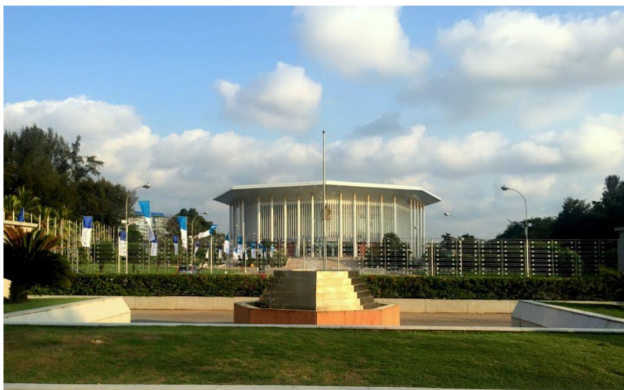
斯里兰卡纪念班达拉奈克国际会议大厦

努瓦拉埃利亚：意为城市之光，位于斯中部，坐落在斯第一高峰皮杜鲁塔拉噶拉山麓，海拔1896米，有“东方瑞士”、“小英伦”之称，人口约77.3万人，距科伦坡180公里。