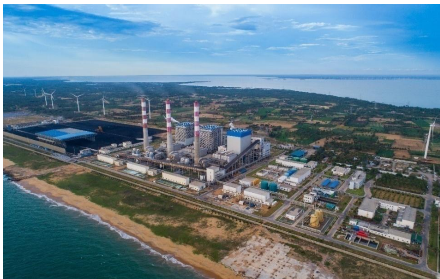
普特拉姆燃煤(Lakvijaya)电站

【普特拉姆燃煤电站】由中国提供贷款建设的普特拉姆燃煤电站（建成后更名为：Lakvijaya电站）是斯目前唯一的燃煤电站。该电站一期一台300MW机组于2011年5月建成发电，二期两台300MW机组分别于2014年5月和10月建成发电。电站装机容量占斯全国装机容量约22%，年发电量占全国用电量约37%，最高单日发电量占全国用电量67.8%。截至2021年2月底，三台机组总发电量427.28亿kW.h，净输出385.27亿kW.h，平均发电可利用率超过85%。