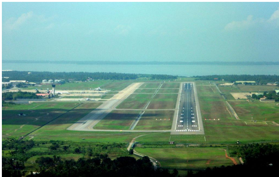
班达拉奈克国际机场