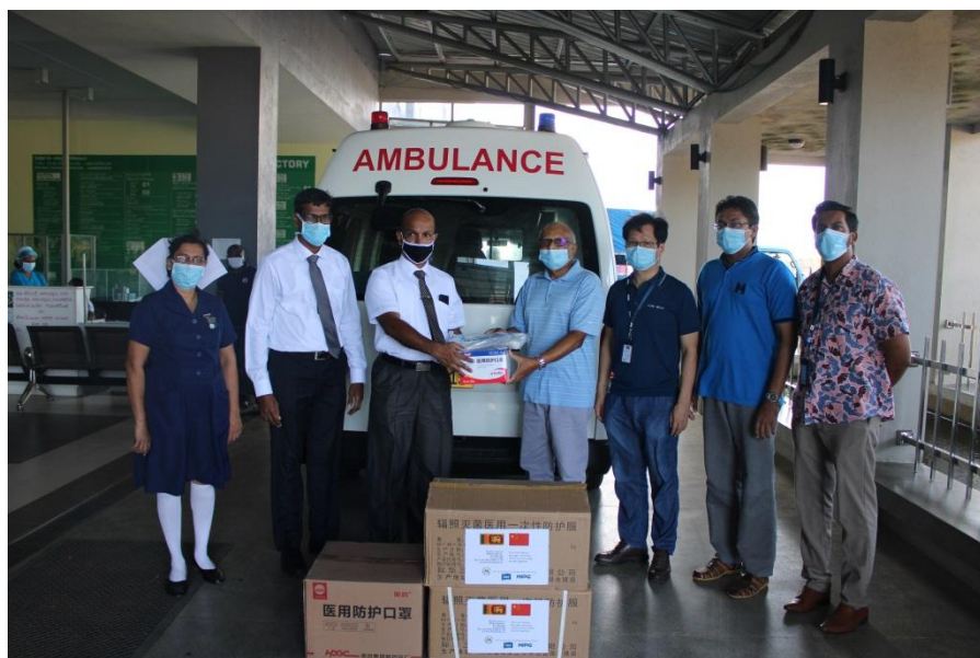
向汉班托塔地区总医院捐赠紧急医疗防护物资