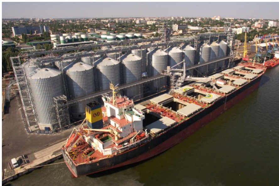
中粮集团乌克兰公司尼古拉耶夫码头

2019年，中国从乌克兰进口商品主要类别包括：①矿砂、矿渣及矿灰；②谷物；③动植物油脂及其分解产品；④食品工业残渣及废料配制的动物饲料；⑤木及木制品；木炭；⑥钢铁；⑦制粉工业产品；麦芽；淀粉等；面筋；⑧锅炉、机器机械；⑨电机、电气、音像设备及其零件；⑩乳、蛋、蜂蜜、其他食用动物产品。