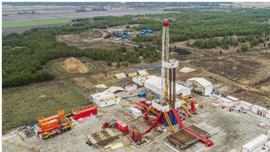
新疆贝肯能源乌克兰公司承包乌油气公司钻采项目

包工程项目包括东方电气集团国际合作有限公司承建乌克兰斯拉维杨火电EPC项目；中铁国际集团有限公司承建乌克兰保障房建设及供应项目；华为技术有限公司承建乌克兰电信项目等。