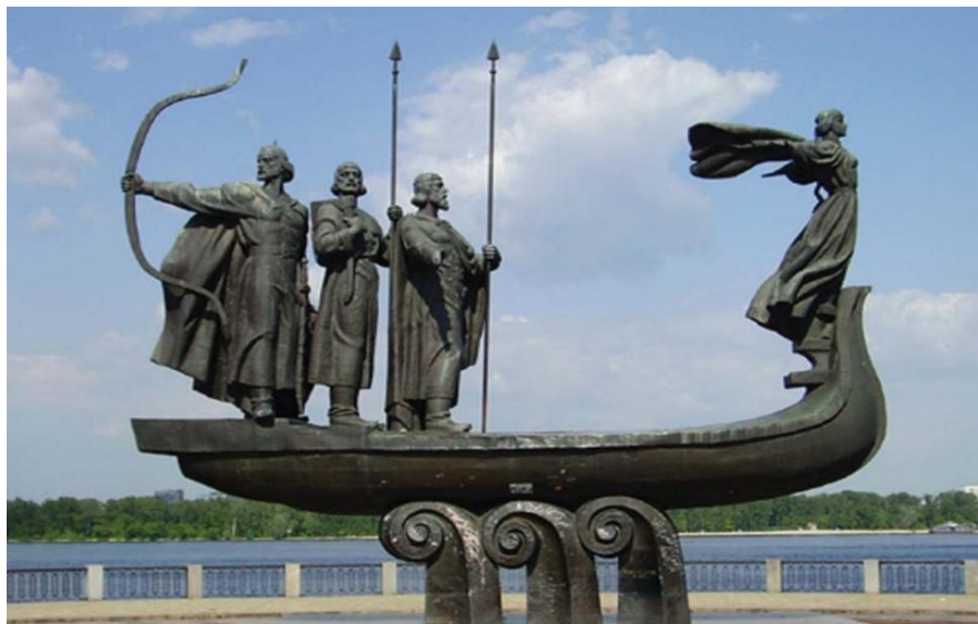
基辅创始人四兄妹雕像

乌克兰全国大部地区为温带大陆性气候。1月平均气温-7.4℃，7月平均气温19.6℃。克里米亚为地中海型亚热带气候。