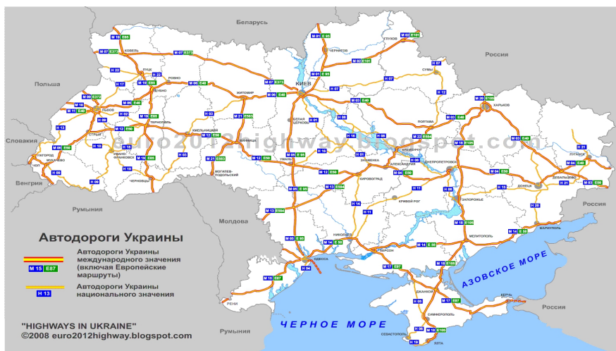
乌克兰国际公路图

乌克兰公路里程为16.9万公里，其中，2.1万公里为国家级公路，14.8万公里为地方级公路。此外，乌克兰共有23条国际公路，总长度8093.9公里。乌克兰是连接欧亚的重要交通枢纽，与周边国家俄罗斯、白俄罗斯、波兰、匈牙利、罗马尼亚、摩尔多瓦都有国际公路连接。