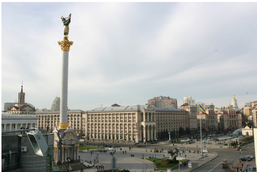
乌克兰基辅独立广场

1917年，东乌克兰地区建立苏维埃政权，成立乌克兰苏维埃社会主义共和国。1922年，苏联成立，乌克兰加入联盟（西部乌克兰于1939年加入）。